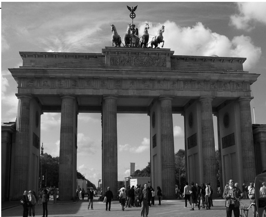
Das Brandenburger Tor in Berlin