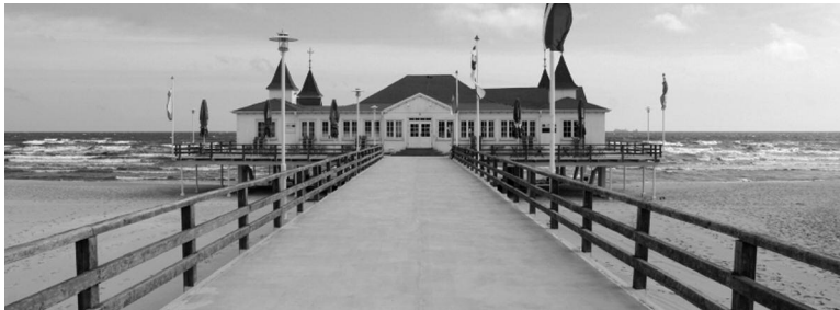
Der Pier in Usedom